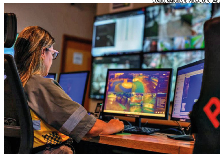
Equipes trabalham no monitoramento de estragos e problemas em bairros da cidade

Moradores com imóveis danificados devido às fortes chuvas e que precisam registrar ocorrências devem acessar o serviço online Cadastro de Pessoa Afetada por Desastre ou procurar atendimento no Centro Administrativo Municipal, na rua Venâncio Aires, 2277. O atendimento ao público ocorre das 8h ao meio-dia e das 13h às 17h