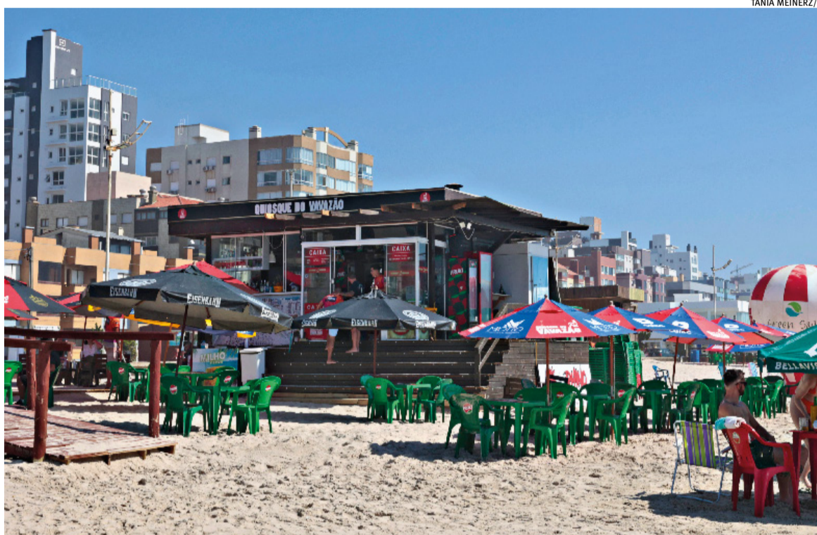
Associações de Capão da Canoa e Arroio do Sal estão organizando documentos para entregar solicitação ao governo federal

A proposta prevê a regularização do uso da faixa de areia ao longo de todo o ano, com exigências como licenciamento