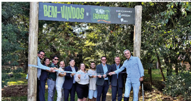
Percurso tem cerca de 700 metros de distância e duração média de 45 minutos