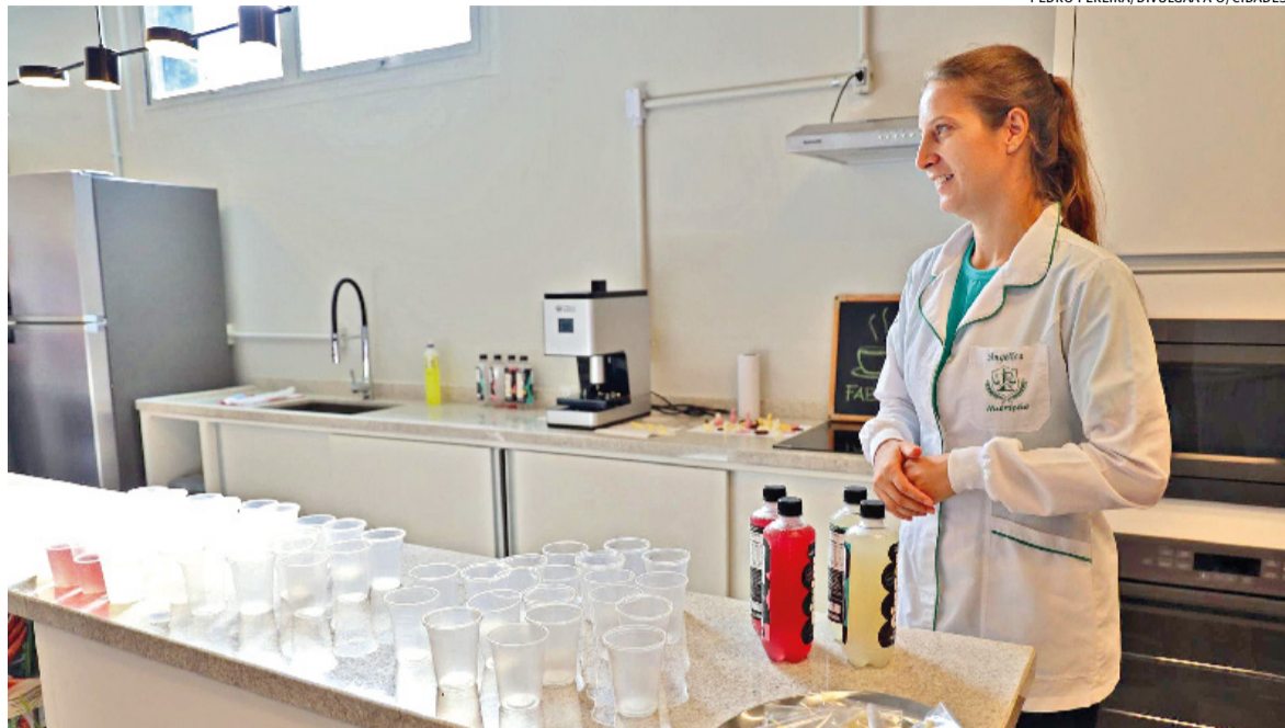
Pesquisadores poderão testar ingredientes e criar alimentos e bebidas, a fim de ter uma cadeia alimentar mais sustentável

A UFSM inaugurou um dos mais avançados laboratórios maker de foodtech do Brasil. Integrado ao Parque Tecnológico da universidade e viabilizado com recursos do Ministério da Agricultura e Pecuária (Mapa), o Foodtech FabLab é um espaço de prototipagem, validação tecnológica e desenvolvimento de soluções que tem a missão de promover a inovação e o empreendedorismo no setor de alimentos, bebidas e suplementos, para transformar a cadeia alimentar de forma eficiente e sustentável. A iniciativa posiciona Santa Maria como referência nacional na área de alimentos.