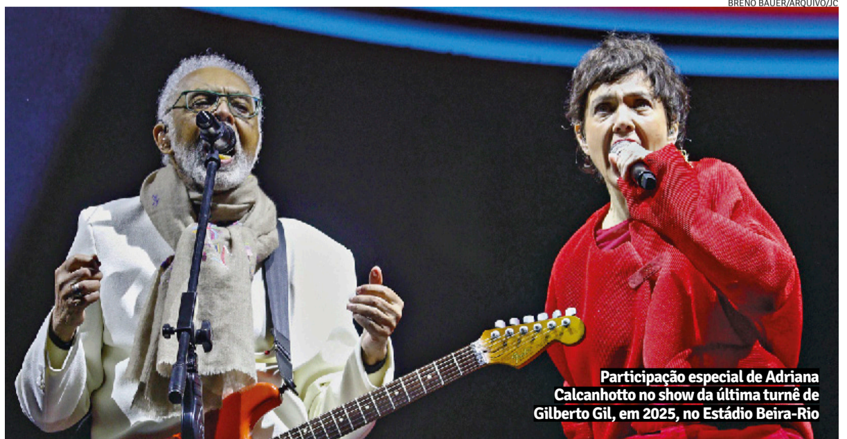
Participação especial de Adriana Calcanhotto no show da última turnê de Gilberto Gil, em 2025, no Estádio Beira-Rio