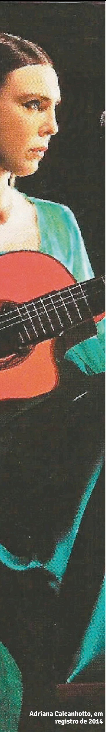
Adriana Calcanhotto, em registro de 2014