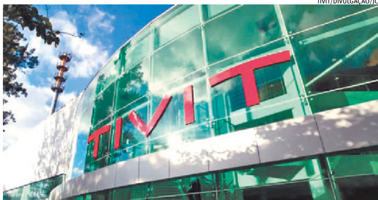
Para obter o selo, empresa passou por uma revisão completa dos processos

Para alcançar o Nível 3, a TIVIT passou por uma revisão completa dos processos da área de Digital, envolvendo governança, qualidade, previsibilidade e padronização das entregas.