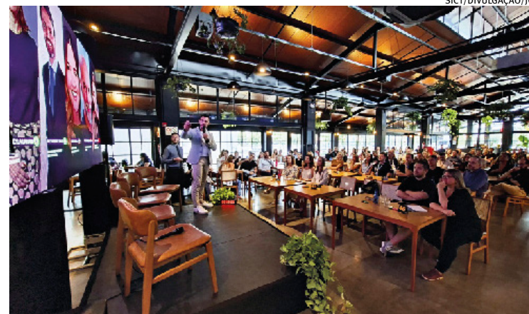
Encontro reuniu empresários locais para discutir desafios da nova economia

O programa ConectAI, que tem meta de treinar 5 milhões de brasileiros em habilidades de IA até 2027, já registrou mais de 6,6 milhões de brasileiros que iniciaram algum treinamento e 2,8 milhões concluíram seus cursos.