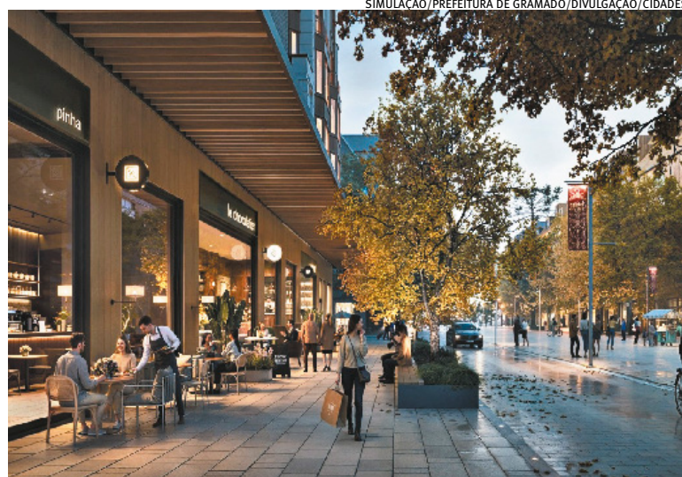
SIMULAÇÃO/PREFEITURA DE GRAMADO/DIVULGAÇÃO/CIDADES

A expectativa da administração é encaminhar a primeira proposta ainda na primeira quinzena de fevereiro e a segunda em março. A meta é ter o arcabouço legal aprovado no primeiro semestre, permitindo que os primeiros movimentos