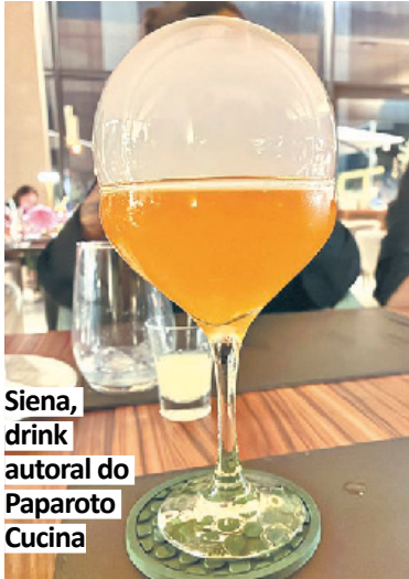
Siena, drink autoral do Paporoto Cucina