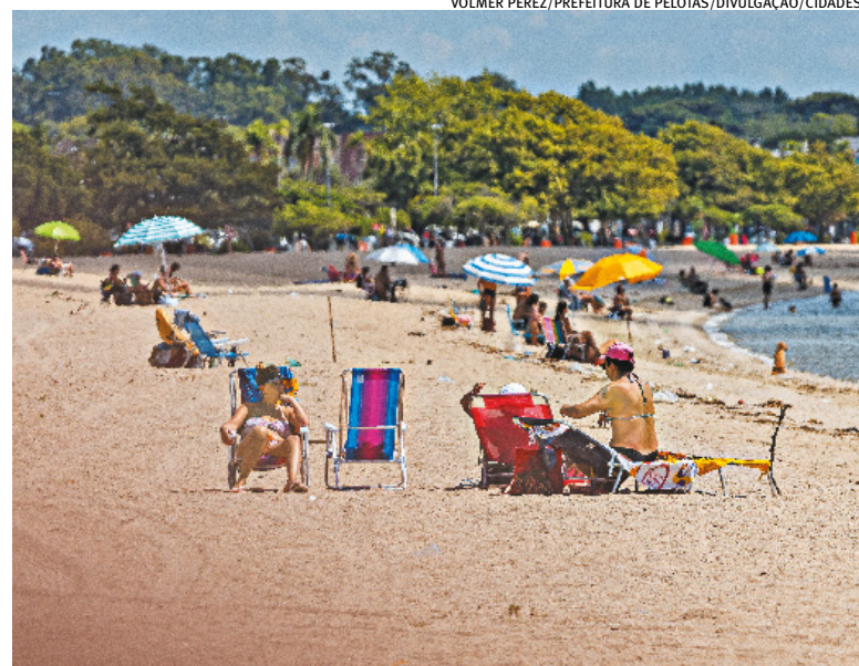
Última coleta no balneário ocorreu entre os dias 26 e 27 de janeiro de 2026

Para que a segurança seja garantida, banhistas devem respeitar as sinalizações e orientações dos guarda-vidas, usar protetor solar, reforçar a hidratação, consumir alimentos mais leves, evitar as primeiras 24 horas após chuvas intensas ou em períodos de cheia e não tomar banho em locais com concentração de algas.