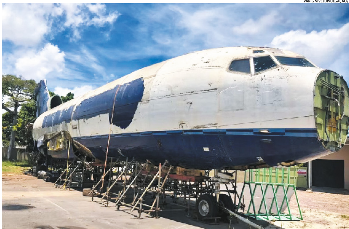
Empreendimento tem como peça central o Boeing 727 PP-VLD, última aeronave da frota da Viação Aérea Rio-Grandense

Conforme o projeto apresentado, o Boulevard Varig Vive contará com um hotel de 100 quartos, memorial dedicado à história da Varig com experiências imersivas, centro comercial com opções de gastronomia e