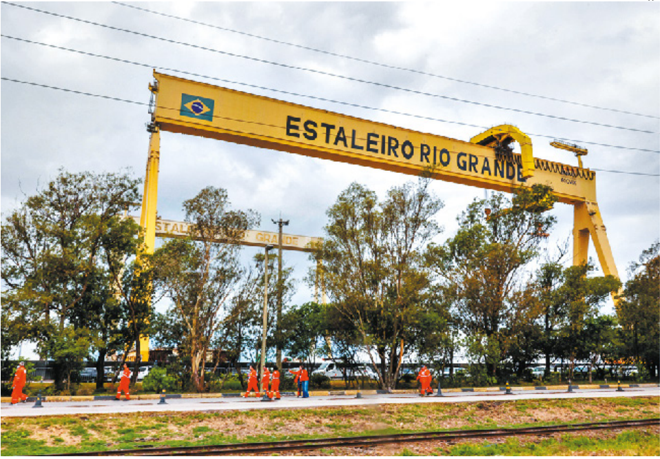
Contratação de navios a serem fabricados no Estaleiro Rio Grande deve impulsionar o polo naval