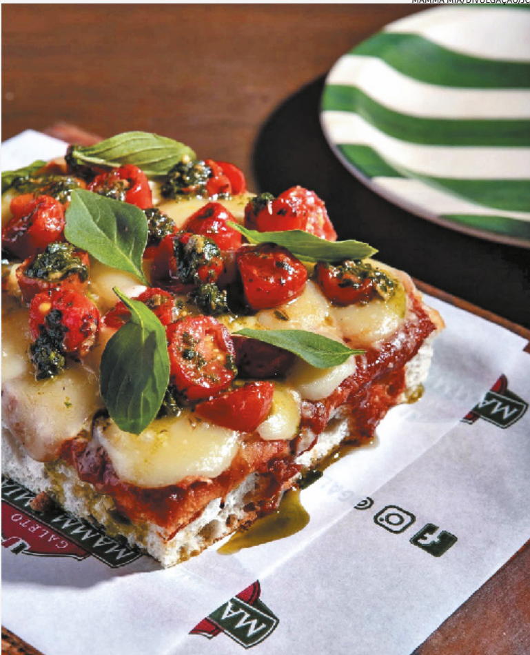
Pizzas integram o novo cardápio do Mamma Mia