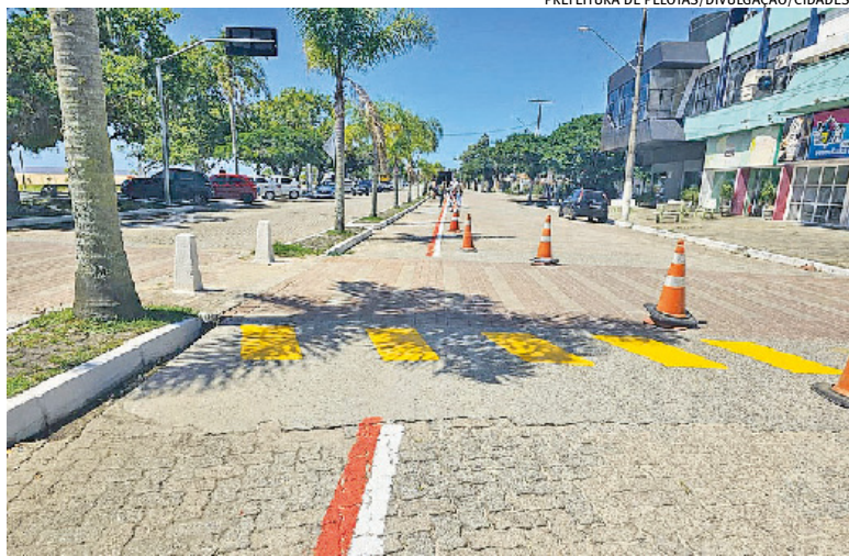
Serviço inclui nova sinalização na via, reforço em lombadas e faixas de pedestre