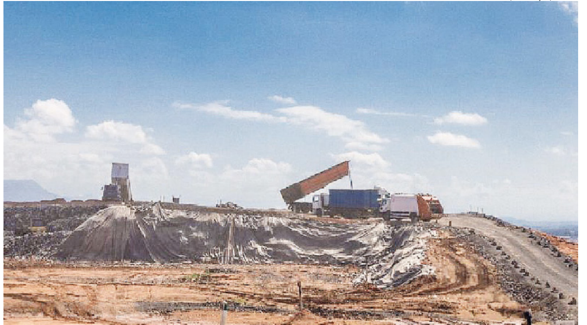
Empresa que administra aterro de São Leopoldo nega filas no depósito de resíduos; Canoas fala em mutirão para coleta de lixo