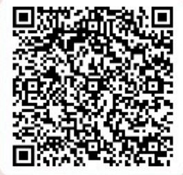
LEIA O QR CODE

O 2º Caderno é publicado diariamente no digital e no impresso. Nosso portal oferece um ambiente confiável para a divulgação de atas, avisos, balanços, comunicados aos acionistas, convocações e editais. Tradição, credibilidade e tecnologia para garantir a segurança das suas publicações.