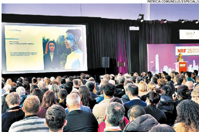
Cassandra apresentou como as pessoas devem agir até 2027

Lembrando: o tema da NRF deste ano é "Game Changer", no inglês, que pode ser traduzido como "Divisor de Águas". Cassandra projetou tendências sociais e de consumo. Na cesta, está, por exemplo, a adesão ao uso de assistentes de IA e que 82% das pessoas querem aprender mais sobre a tecnologia. O estudo é de contrastes, pois 57% dos consumidores globais gostariam que seus países fossem como no passado.