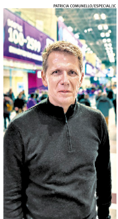
Inteligência Artificial ainda tem muito o que avançar, diz Faccio