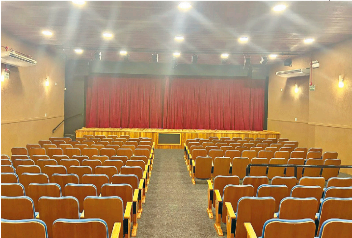
Além de ganhar mais cadeiras, espaço foi modernizado com a reforma do palco, troca do carpete e do piso