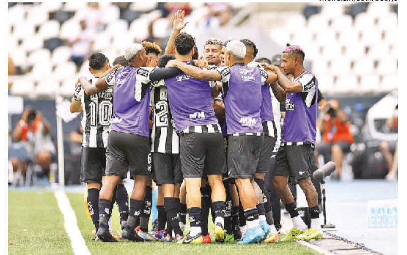
Em uma temporada gloriosa, os cariocas ergueram o tricampeonato