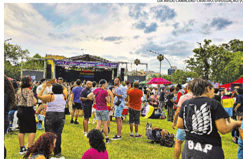
Aos poucos, milhares de pessoas foram tomando o Parque da Redenção