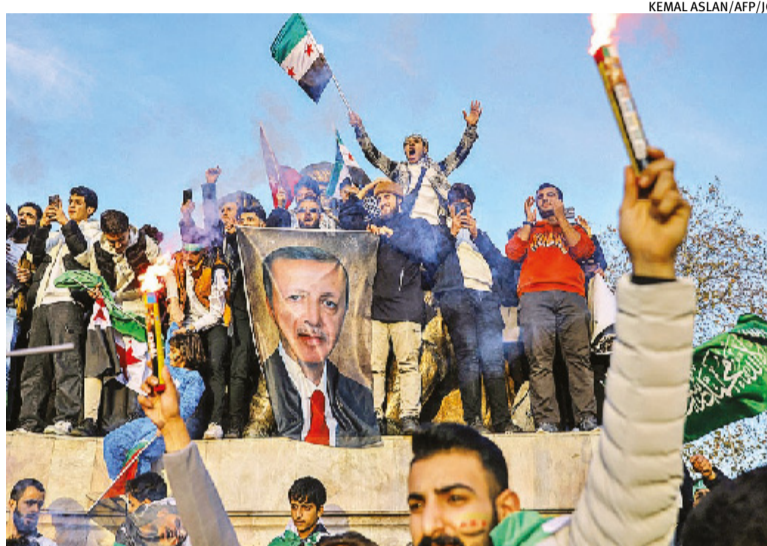
População celebra fim de ditadura em cenário de incertezas

Enquanto isso, o comando do Exército notificava os militares da queda do regime de Assad, disse um militar à agência Reuters sob anonimato. As forças negaram a informação oficialmente, dizendo que seguiam com as operações contra os “grupos terroristas” nas cidades de Hama e Homs, no centro, e na zona rural de Daraa, no Sul. Autoridades também afirmaram sob reserva que o Hezbollah, grupo islâmico libanês que por anos forneceu apoio crucial a Assad, retirou todas as suas forças de segurança da Síria no próprio sá-