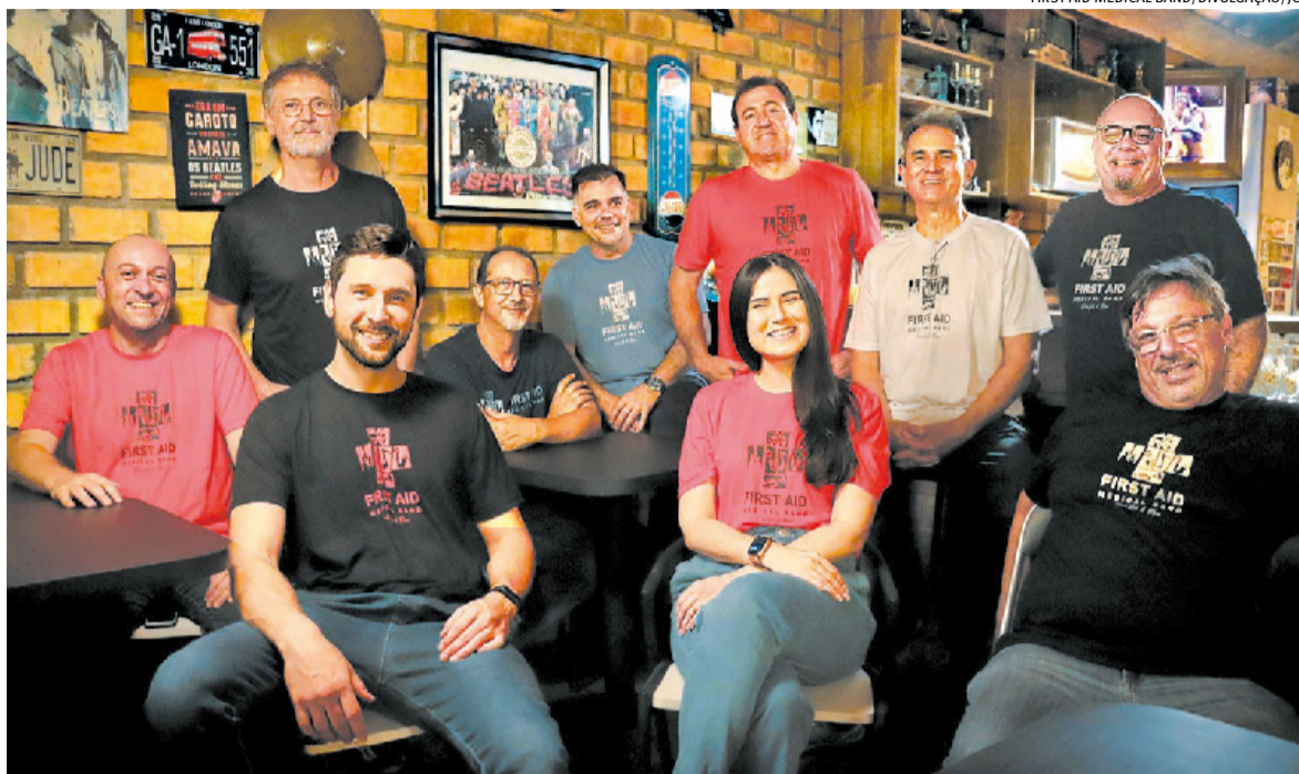
FIRST AID MEDICAL BAND/DIVULGAÇÃO/JC

fernando.albrecht@jornaldocomercio.com.br