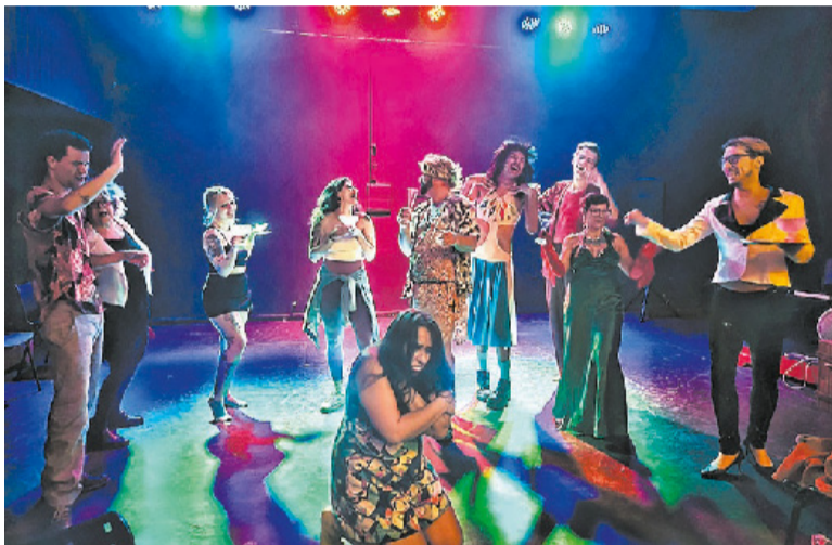
Montagem teatral Las emociones de familia tem direção de Leo Maciel

novelas mexicanas e na estética dos filmes do diretor espanhol Pedro Almodóvar, a montagem traz à cena personagens diversos que exploram as complexidades das relações familiares, com uma carga emocional intensa. Na trama, personagens excêntricos e situações pitorescas se entrelaçam, revelando emoções cruas e sinceras.