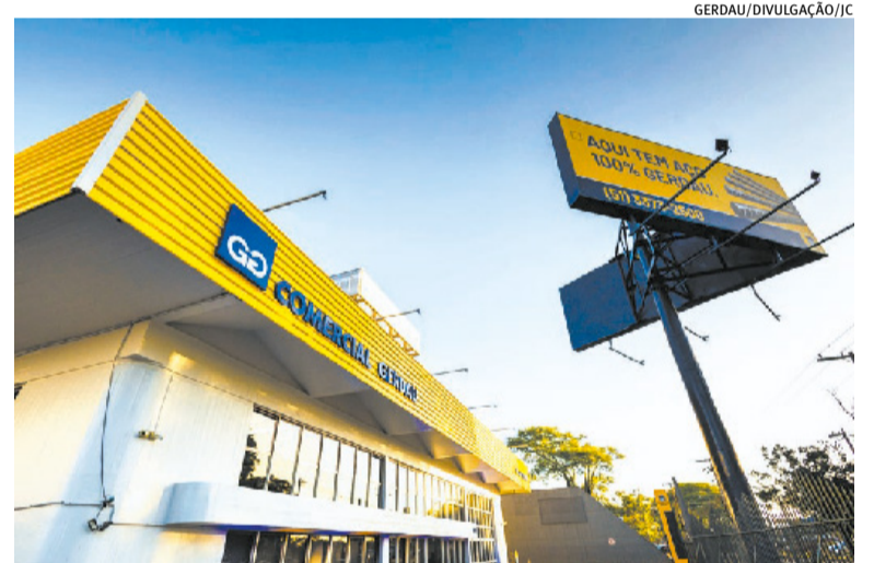
Distribuidora da empresa em Porto Alegre fica no bairro Anchieta

"Como uma empresa gaúcha com mais de 123 anos, a reinauguração da Comercial Gerdau é um momento muito significativo para a companhia, que marca a reabertura de um espaço em que podemos estar próximos de nos-