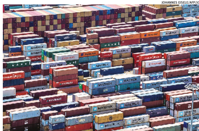
Com redução de tarifas, Brasil estima alta de R$ 52,1 bi nas exportações

“O impacto não é assim tão rápido. A geração de empregos deve demorar a dar resultados. Mas com esse acordo você aumenta o comércio. Além disso, com o acordo, aumenta o poder de negociação com a China e os Estados Unidos. Tem um elemento político também nesse acordo, para além