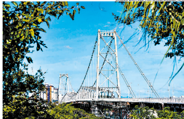
Florianópolis foi destino de muitos gaúchos durante as enchentes