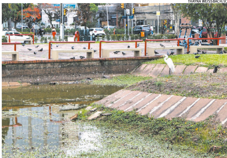
Peixes convivem com o baixo nível de água e resíduos no local

O Dmae, por outro lado, informou que a administração do Praia de Belas “registrou um protocolo na tarde desta quinta-feira, relatando a dificuldade no abastecimento de água no lago artificial localizado na Praça Itália”.