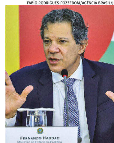
Reforma da renda não tem vínculo com medidas, diz Haddad

ciamento em cadeia nacional de rádio e TV indicam que o pacote foi desidratado antes mesmo da divulgação. O governo estava pressionado por investidores para apresentar medidas que garantissem o equilíbrio das contas públicas. O pacote chega ao Congresso faltando um mês para o início do recesso parlamentar e com uma agenda carregada de votações na área econômica. As medidas de contenção de despesas serão enviadas por meio de uma PEC (proposta de emenda à Constituição) e um projeto de lei complementar.