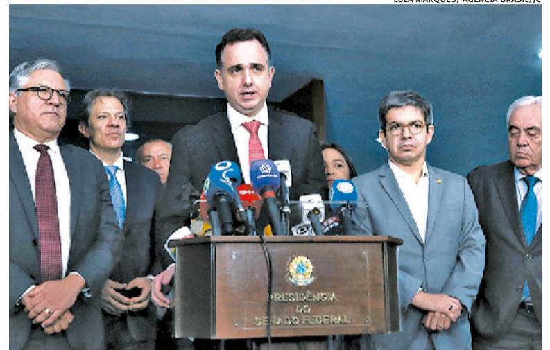
Presidente do Senado reiterou compromisso com apreciação neste ano

Lideranças das duas Casas afirmam reservadamente que, se os recursos não forem liberados, nenhuma pauta de interesse do