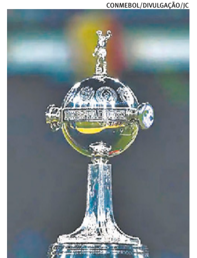
Final do torneio será neste sábado no estádio Monumental de Núñez

Em seus dois confrontos diretos neste ano, os mineiros levaram a melhor no saldo final, com uma vitória e um empate. Os cariocas, porém, chegam para o embate em um momento melhor, liderando o Brasileirão com três pontos de diferença para o segundo colocado. O Galo, por sua vez, perdeu a final da Copa do Brasil e ainda recebeu a punição de seis jogos com portões fechados em virtude de confu-