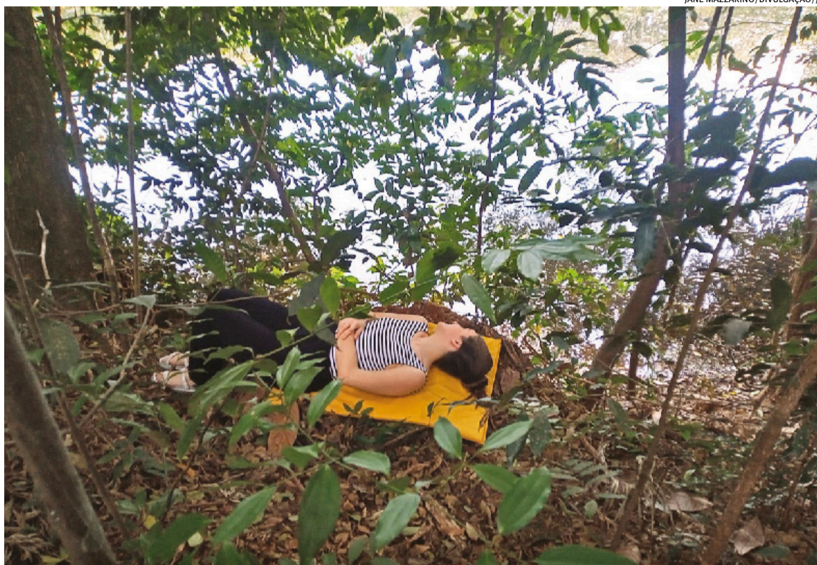
Passar um tempo em contato com a natureza pode reduzir ansiedade, estresse, tensão e emoções negativas

Para Machado, o autocuidado entre os médicos é necessário, assim como é preciso compreender outros determinantes que podem impactar na saúde mental destes profissionais. “Há questões que não estão sob