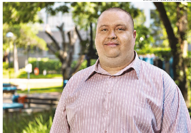
“Há poucos profissionais para atender a demanda pública”, diz Machado

os banhos de florestas fazem parte da política pública de saúde. “No Brasil, há um movimento para incluímos eles em uma das Práticas Integrativas e Complementares em Saúde (PICS),