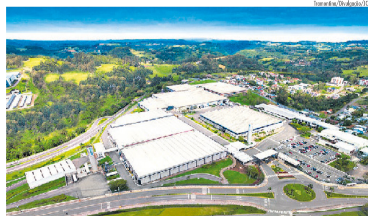
Empresa tem plantas em Carlos Barbosa, Farroupilha e Garibaldi

Aberto ao público em geral, os conteúdos têm o objetivo de oportunizar que mais pessoas tenham a chance de se desenvolver pessoal e profissionalmente. A plataforma também conta com o ambiente Crescer+, onde são oferecidos cursos e treinamentos em EAD, para diferentes públicos, como Liderança, ESG, Gerenciamento de Proje-