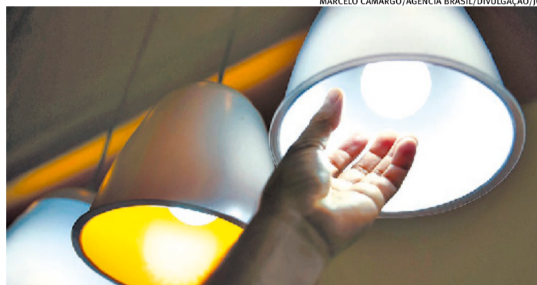
Alterações nas contas de luz foram aprovadas ontem pela Aneel