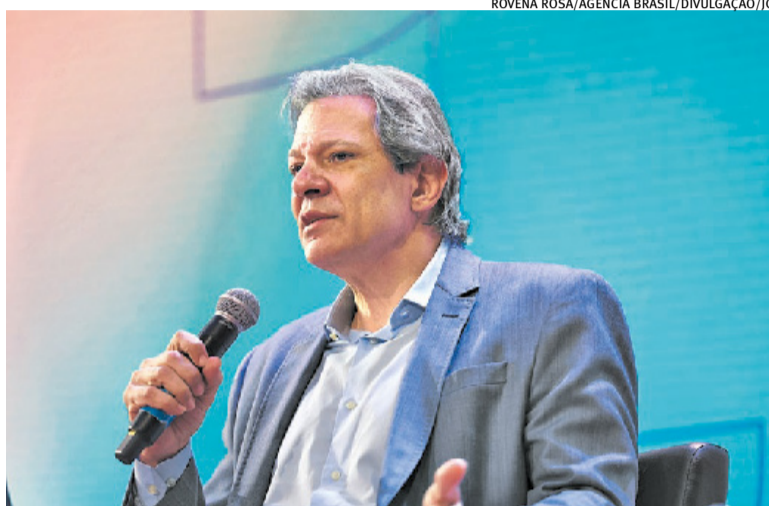
Fernando Haddad diz que renegociação não pode trazer prejuízo à União

“Eu penso que 4% de juro real em cima do IPCA é realmente insustentável, porque a arrecadação não cresce 4% ao ano. Eu sou a favor, eu entendo o pleito dos governadores. Mas você não pode cobrir a cabeça e descobrir o pé, você tem que fazer um jogo que acomode as contas estaduais sem prejudicar as contas nacionais, esse é o meu ponto de vista. E no meu entendimento, o projeto apresentado precisa passar