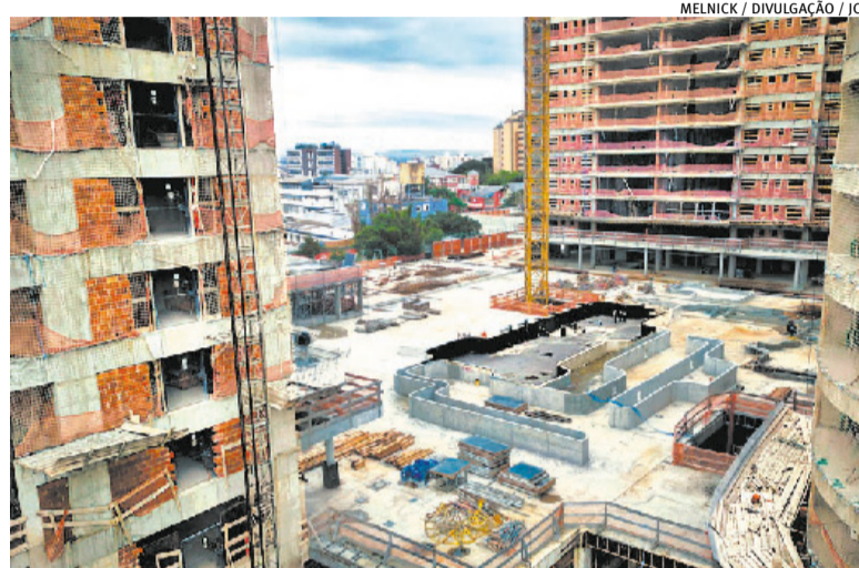
Durante as cheias, alguns canteiros de obras ficaram parados por até 40 dias

Em pesquisa realizada no dia 4 de junho, o Sinduscon-RS observou que 61,9% das empresas consultadas registraram falta de mão de obra no mês de maio. O principal motivo, evidentemente, foi o prejuízo que muitos trabalhadores enfrentaram com as enchentes. Nos primeiros dias de julho, uma parcela dessa força de traba-