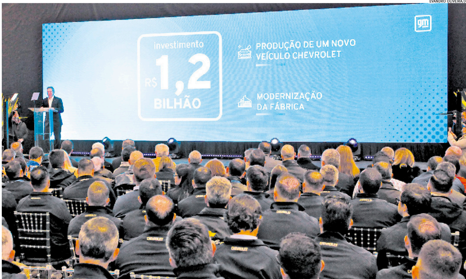
Presidente da GM América do Sul, Santiago Chamorro fez anúncio oficial da modernização da fábrica e destacou produtividade na planta gaúcha

Carro a ser produzido em Gravataí irá ao mercado em 2026, mas formato é mantido em sigilo p. 8 e 9