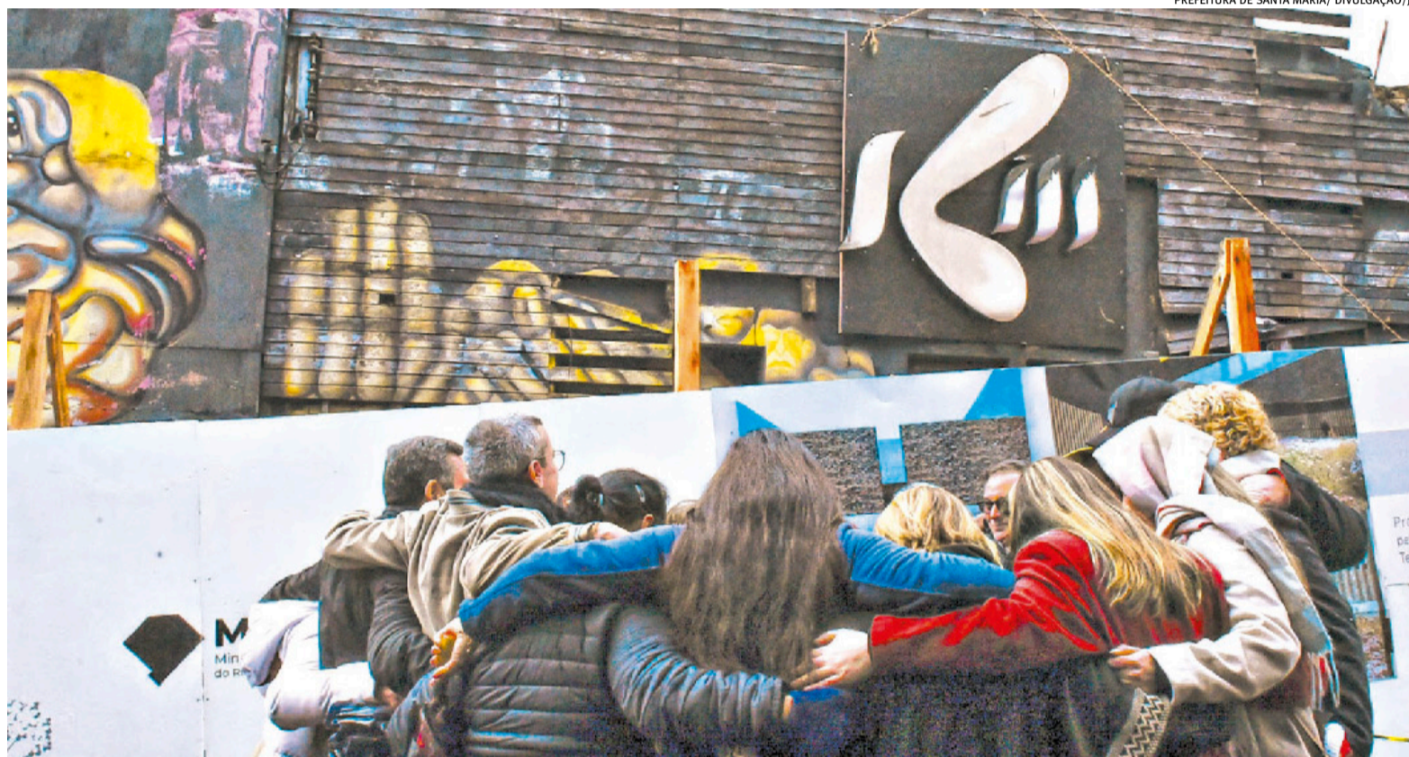
Cerimônia realizada ontem em frente ao prédio da casa noturna reuniu parentes das 242 vítimas do incêndio que ocorreu há onze anos p. 19

Deputados aprovam regulamentação da lei que reorganiza impostos, com mudanças no projeto p. 14