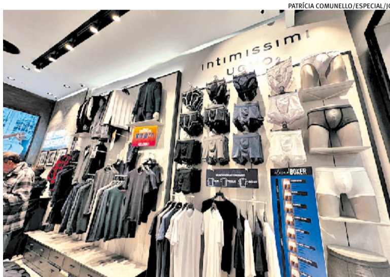
Marca italiana de roupa masculina é a segunda implantada no Brasil

Todas as marcas do grupo vendem itens importados. A operação abriu no segundo piso do shopping, numa posição com muito fluxo. "Os gaúchos são os