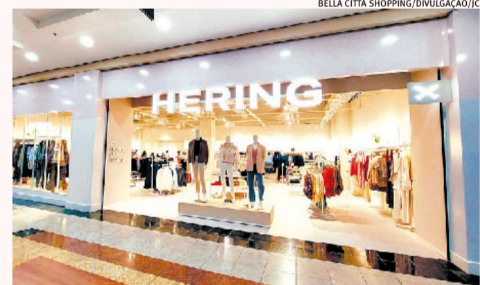
Nova unidade está entre as maiores operações da rede de moda