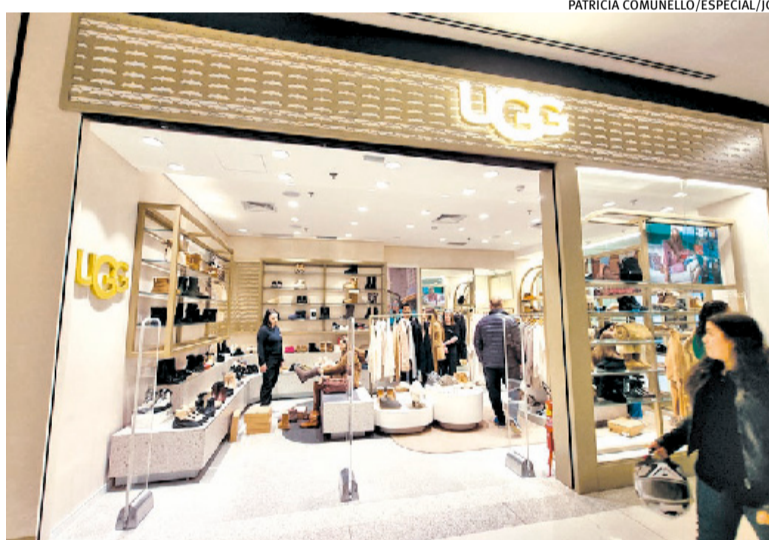
Loja famosa pelas botas de frio abriu em junho a sexta operação no País