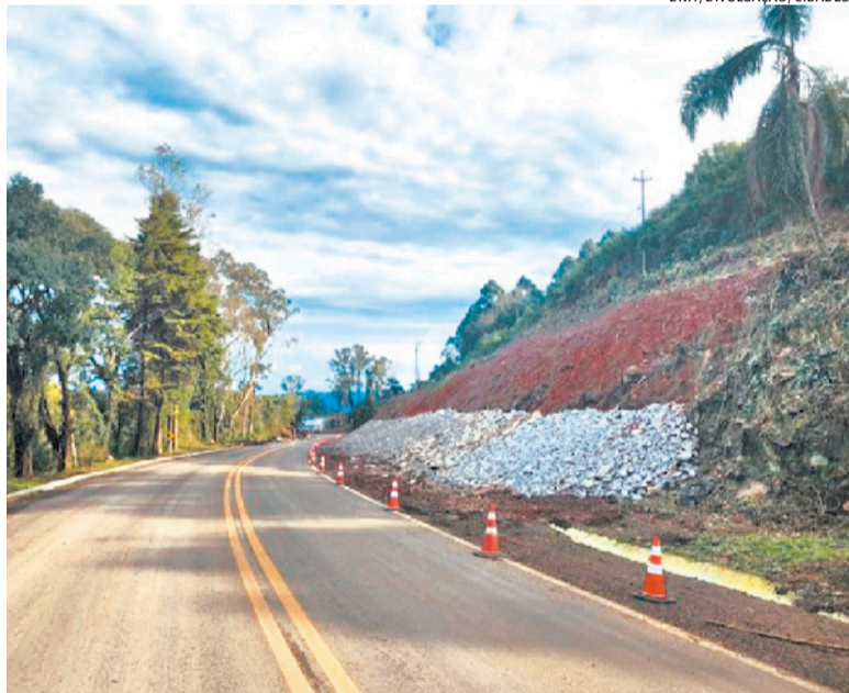
Dnit trabalha na reconstrução das encostas na estrada da Serra gaúcha