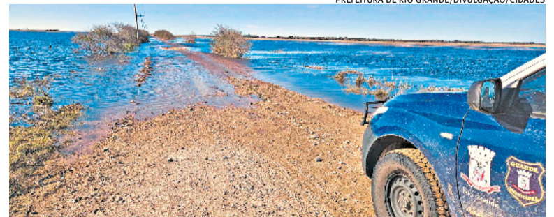
Vias de acesso na cidade foram tomadas pela água na segunda-feira