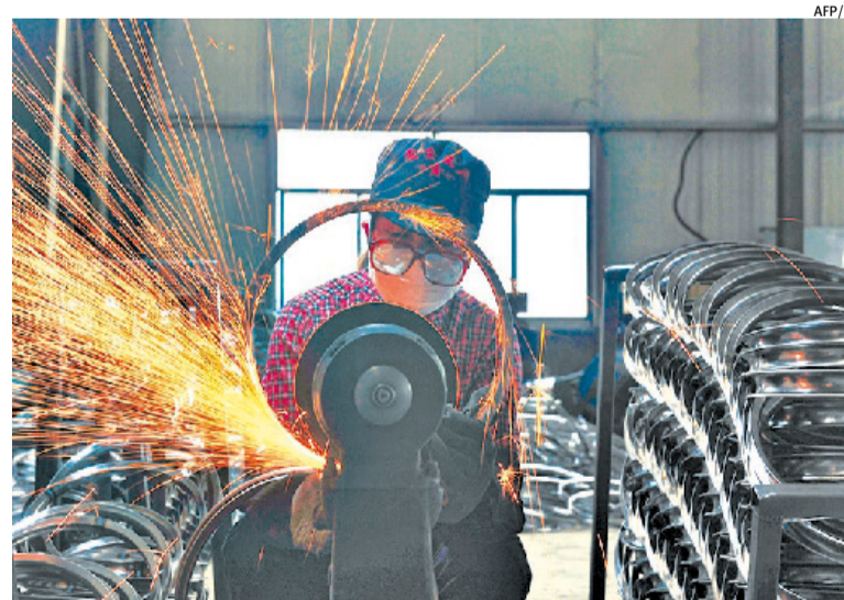
Em maio, 55,5% das empresas relatam redução da produção ante abril

lização da capacidade instalada (UCI) da indústria gaúcha recuou bastante em maio, atingindo 57%: uma diferença de 14 pontos percentuais a menos do que na comparação com abril (71%). O grau