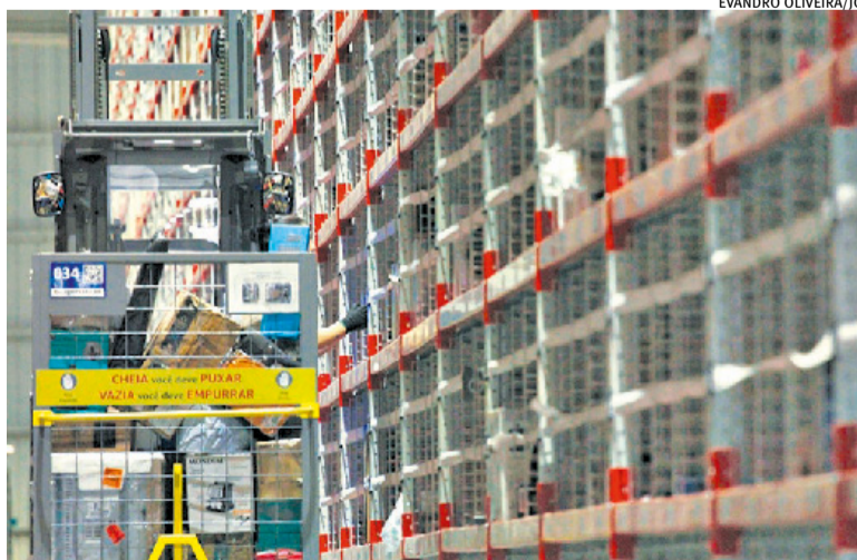
Campanha promocional Prime Day acontece de 16 a 21 de julho

“Também foram identificadas fraudes envolvendo contratos de verba de propaganda cooperada (VPC), que consistem em incentivos comerciais que geralmente são utilizados no setor, mas no presente caso eram contabilizadas VPCs que nunca existiram”, informou a PF, por meio de nota, divulgada no início da manhã. Também por meio de nota, o grupo Americanas informou que reitera sua confiança nas autoridades que investigam o caso “e reforça que foi vítima de uma fraude de resultados pela sua antiga diretoria”.