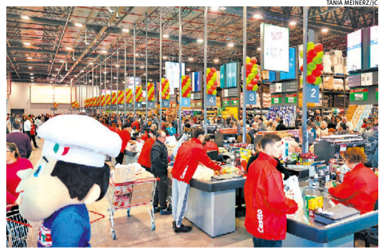
Primeira operação em Porto Alegre abriu as portas ao público nesta quinta

A unidade da Zona Sul custou R$ 114 milhões, acima do orçado, admite a empresa. Um dos motivos de mais tempo e custo é, por exemplo, o estacionamento, situado no primeiro nível, até pela limitação do terreno para ofertar vagas - um item crucial para dar conta da logística deste tipo de mercado. Com isso, a laje de cima (onde fica a loja) precisa