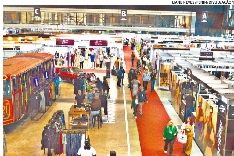
A edição de 2023 do evento atraiu lojistas do Brasil e do exterior

ceu no Rio Grande do Sul, e já contou com edições em cidades como Gramado, São Paulo e Balneário Camboriú. A quarta edição em Santa Catarina trará os lançamentos Primavera/Verão 2024-25.