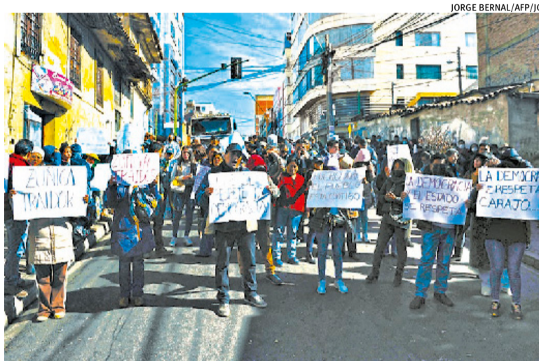
População foi às ruas comemorar a manutenção da democracia no país

O ministro disse ainda que o golpe vinha sendo planejado há três semanas, com a participação de um grupo de soldados. E que o governo chegou a receber