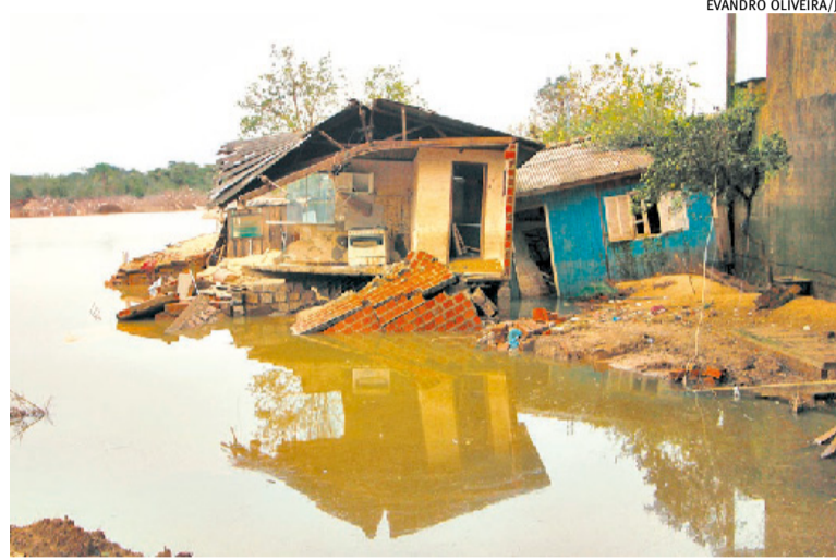
Adiantamento de 2025 para 2024 ocorre em virtude das enchentes no RS

A central sindical tem outros pleitos junto aos governos federal e estadual. Entre eles, um auxílio direto para as pessoas que tiveram suas residências atingidas e precisam reconstruí-las ou reformá-las. “É fundamental uma linha