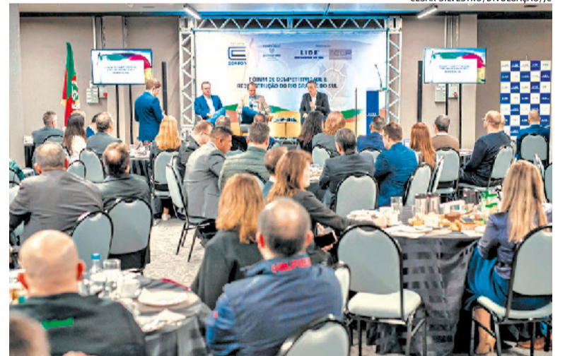
Gestores municipais da Serra se reuniram para organizar a mobilização