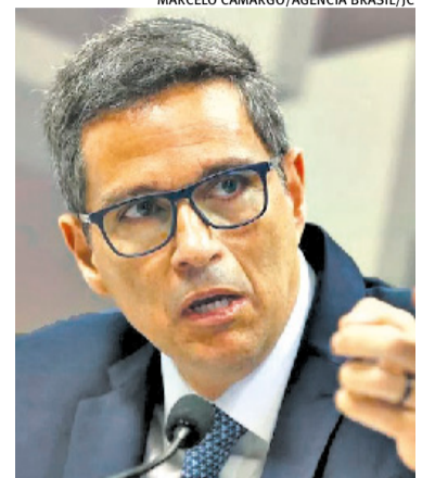
Campos Neto negou convite de Tarcísio para futuro ministério

O presidente do Banco Central também negou nesta quinta-feira que tenha conversado com o governador de São Paulo, Tarcísio de Freitas (Republicanos), sobre a possibilidade de tornar-se minis-