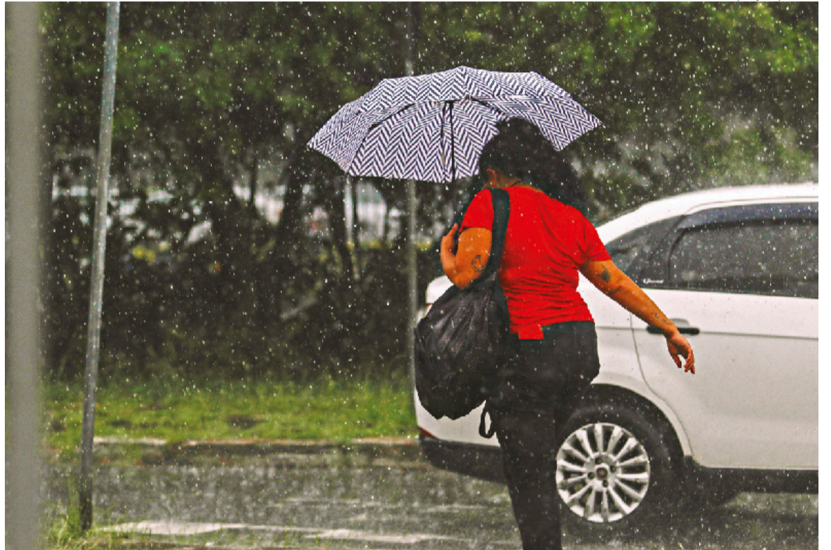
Previsão, feita pelo Núcleo de Informações Hidrometeorológicas da Univates, prevê ação do La Niña na cidade

O Núcleo de Informações Hidrometeorológicas (NIH) da Universidade do Vale do Taquari (Univates) divulgou o boletim de previsão para o inverno na região, destacando os principais prognósticos. Para o Vale do Taquari, a tendência é de que o mês de julho registre as menores temperaturas médias e de que a estação tenha chuvas distribuídas de forma mais irregular ao longo de julho e agosto, com volumes acima da média normal - uma má notícia para a região que, desde setembro, sofreu com três enchentes.