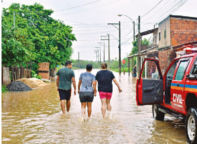
Benefício será direcionado para famílias atingidas pelas enchentes