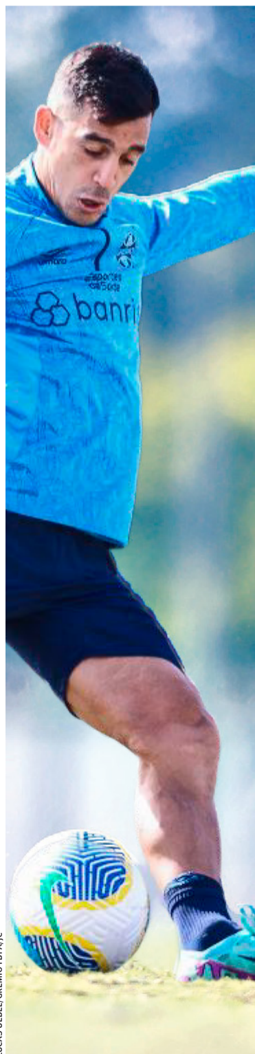
Cristaldo é a esperança técnica no meio-campo gremista

Com apenas seis pontos conquistados em 24 disputados no Brasileirão, o Grêmio vive uma crise dentro e fora de campo. Sem vencer nos pontos corridos desde o dia 20 de abril