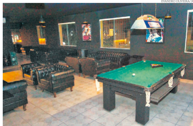
Estabelecimento disponibiliza sinuca gratuita aos seus clientes

próximo à Cidade Baixa, bairro atingido pela enchente, o Korvo não teve sua estrutura afetada. Mesmo assim, foram mais de 20 dias sem operar, algo que é um problema para qualquer empreendedor. "Por estarmos no segundo andar, não fomos atingidos neste sentido. Portanto conseguimos voltar a operar