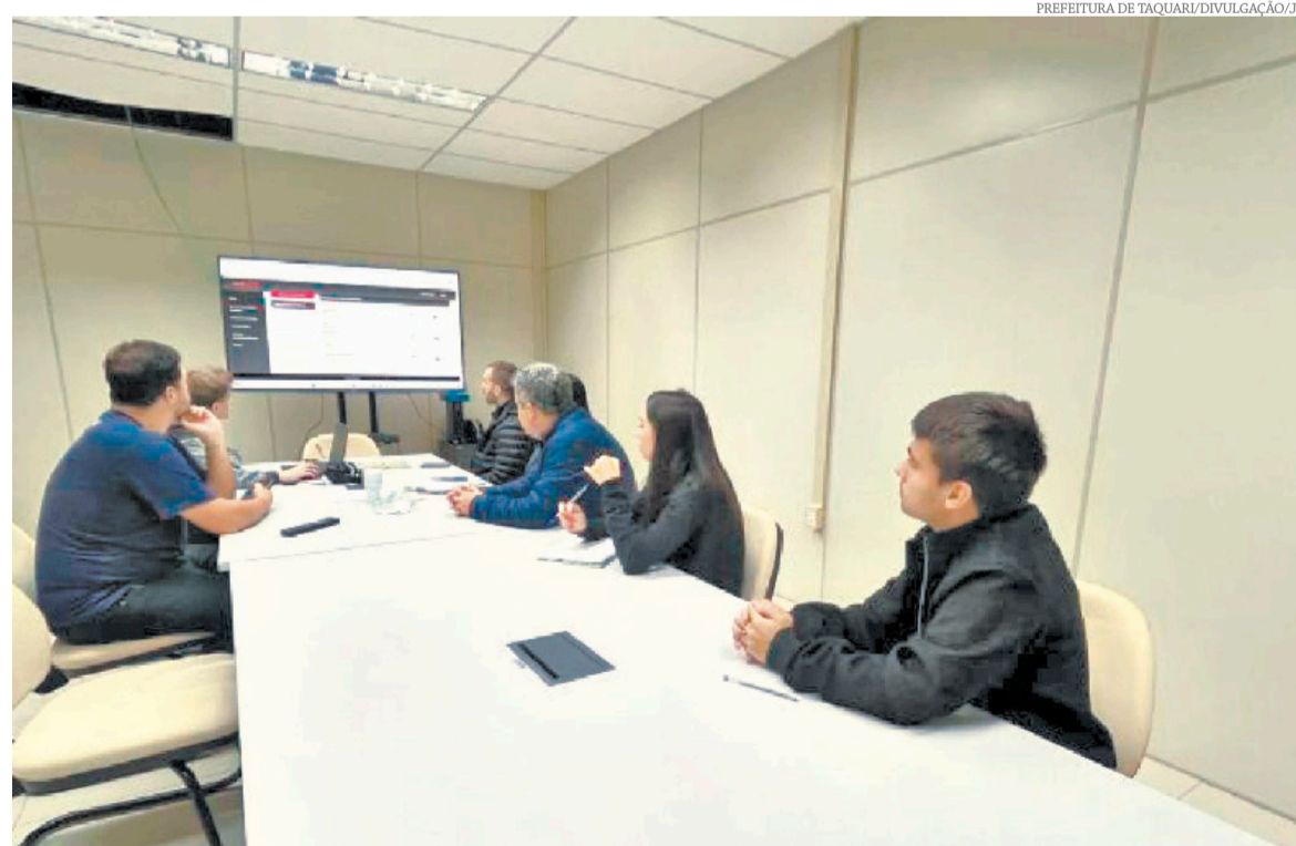
O sistema Safecity, que faz o gerenciamento de doações, já está sendo utilizado na cidade de Taquari