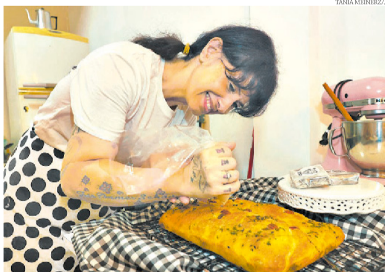
O cardápio traz inspirações da gastronomia internacional