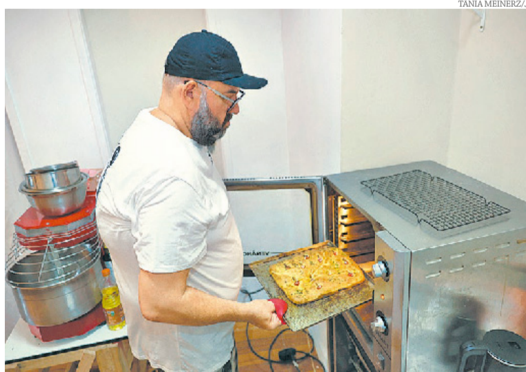
Negócio opera na rua Doutor Sebastião Leão, nº 46, em Porto Alegre

empresa a partir do dia 15 de junho. Além dos produtos para levar, a ideia do casal é que os clientes possam experimentar o cardápio no local.