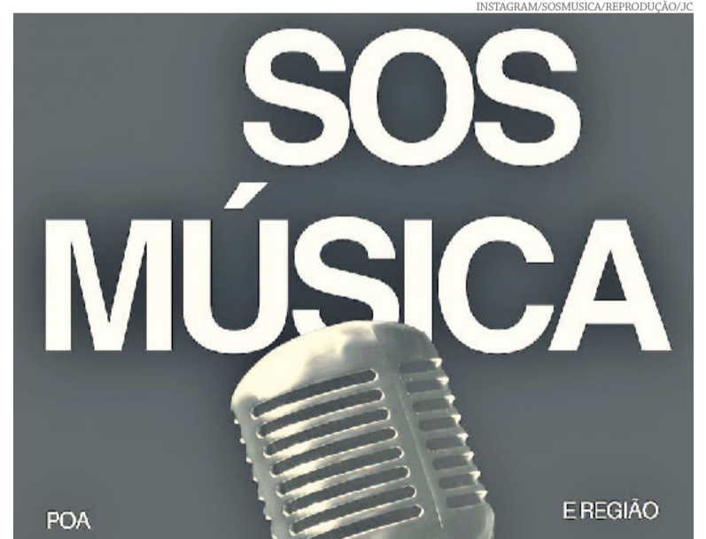
O SOS Música pretende atender os artistas da Grande Porto Alegre

O grupo diz que teve receio de cair em um assistencialismo e garante que esse não é o objetivo. "Não realizamos políticas públicas, não é nosso dever. Entendemos que isso é uma responsabilidade do Estado. O projeto foi o resultado de um movimento da gente, enquanto sociedade civil", reflete. Além disso, os produtores pretendem encontrar parcerias com