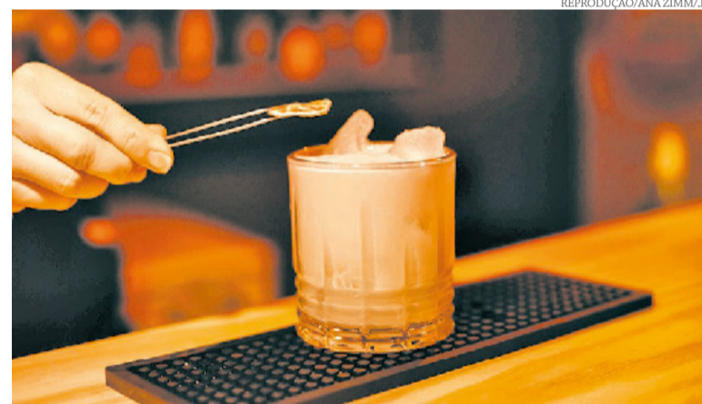
Local oferece drinks a um preço fixo de R$ 28,00