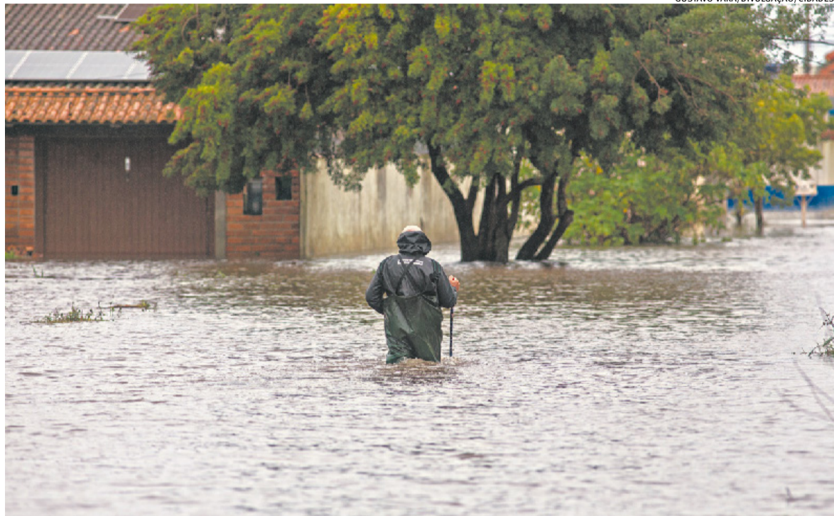
Chegada das águas das chuvas do fim de semana na Lagoa dos Patos pode agravar a situação na cidade