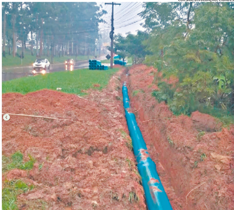
Ligação de 3,8 km é alternativa para viabilizar a chegada da água