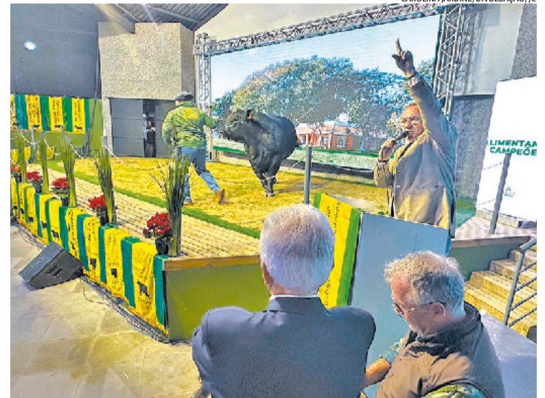
Remate da Reconquista teve ótima performance dos reprodutores

É o peso da participação na mostra na valorização das cabanas e dos produtos. A es-