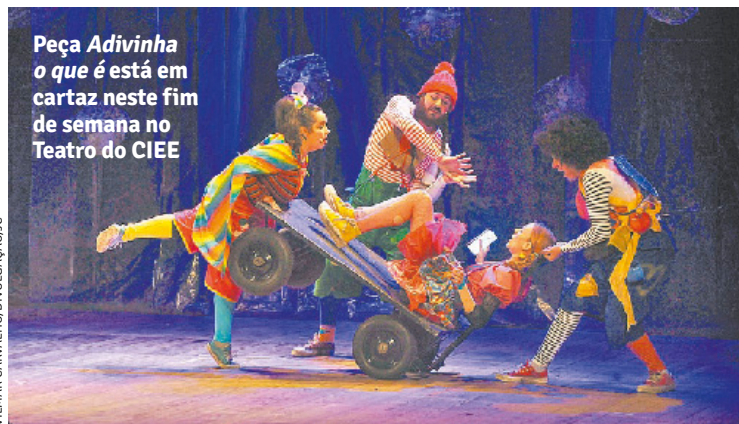
Peça Adivinha o que é está em cartaz neste fim de semana no Teatro do CIEE

cantadas ao vivo pelo elenco. O musical apresenta a história da princesa RosaBranca, que, às vésperas do seu aniversário, tem um pesadelo onde ela se transforma em um botão. Assustada, ela decide que nunca mais vai dormir, deixando todo o reino preocupado. Para restabelecer o sono da menina, o trio de cantadores mágicos leva a princesa para uma jornada de aventuras através da Floresta Mágica do Tempo. Os ingressos estão à venda no site da MegaBilheteria, por valores a partir de R$ 30,00.