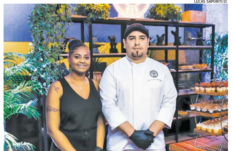
Equipe da Leitaria, que forneceu os produtos do café da manhã no evento