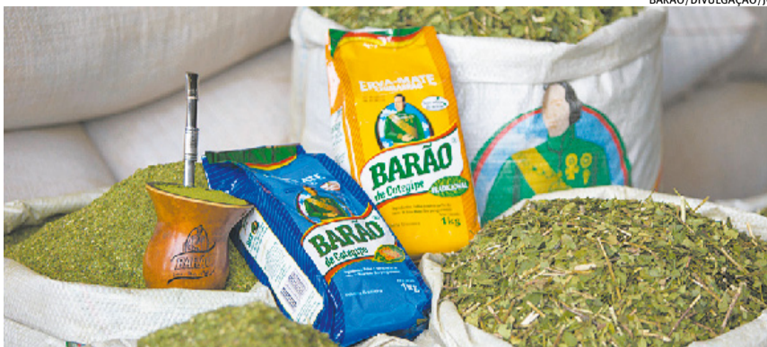
Erva-mate Barão foi destaque no Marcas de Quem Decide pelo quinto ano seguido