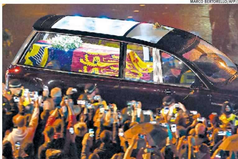
Sob chuva, milhares de pessoas se reuniram para ver o caixão passar